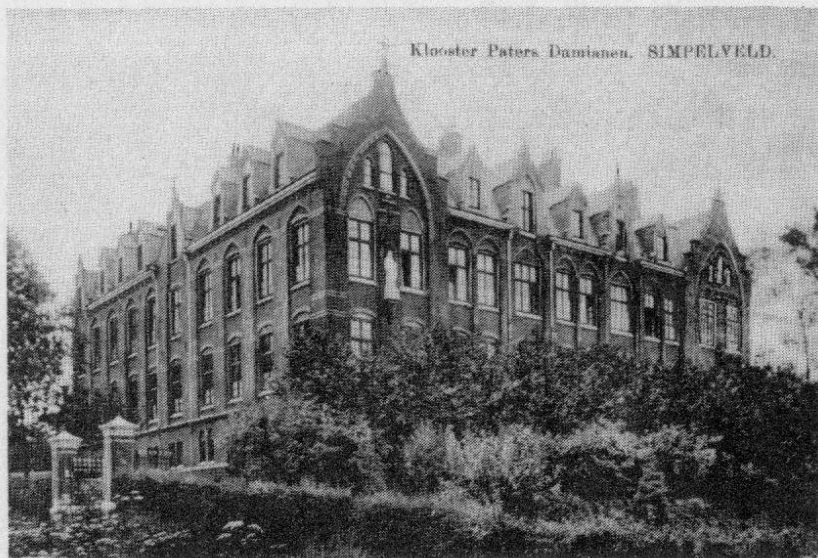
Het klooster van de paters Damianen op de Plaar.