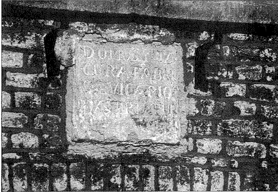
Steen in de gevel van de kapelanie.