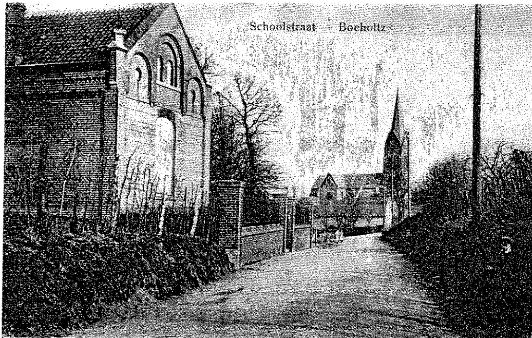
Schoolstraat — Bocholtz