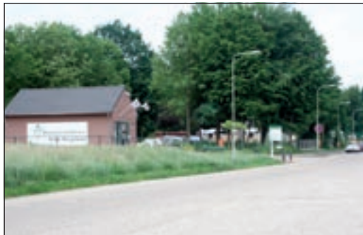
Bungalowpark Simpelveld en Natuurtransferium Poort Mergelland

• Aan uw rechterhand: bungalowpark Simpelveld en Natuurtransferium Poort Mergelland (toeristisch start- en informatiepunt, fiets- en wandelroutes en fietsverhuur)