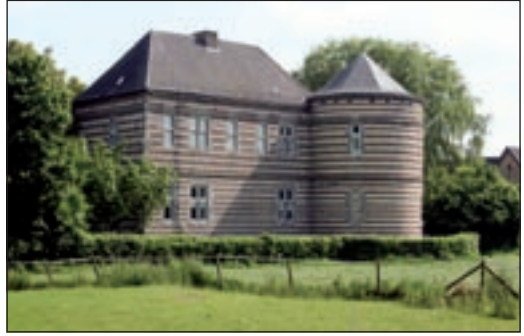
Kasteel De Bongard

Het goed behoorde al in 1314 toe aan de belangrijke familie Van den Bongard. Door erfopvolging werd de familie 'heer' van Simpeldeld en Bocholtz. Sinds 1626 was het kasteel zetel van de heerlijkheid Bocholtz en Simpeldeld. Vanaf 1678 ging het via huwelijk over aan het geslacht Von der Leyen. Sinds 1926 bewoond door de familie Schnackers, die sinds de jaren zeventig van de vorige eeuw ook eigenaar is.