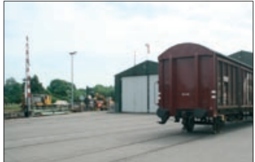
Werkplaats en rangeerterrein ZLSM