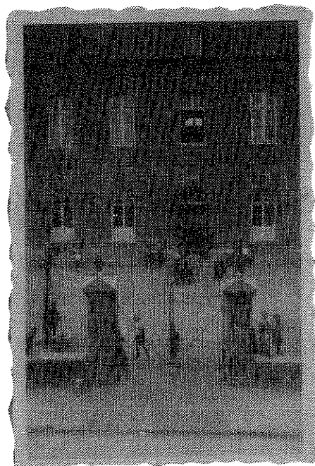
De speelplaats van de vroegere Jongensschool. Links naast de poort de waterpomp

Op 12 september 1916 dienen de bewoners van het gehucht Hondsruc een aanvraag in voor een subsidie om een put aldaar te slaan. De gemeente wil 60% bijdragen en de bewoners (zes huisgezinnen) 40%. Naderhand geeft de gemeente zelfs 75%. Het Heerschap van Imstenrade, adres onbekend, krijgt drinkwater van Hondsruc via buizen. Dit Heerschap was de heer Scheepens, reder in Antwerpen en eigenaar van kasteel Imstenrade. Men zat in 1916 midden in de Eerste Wereldoorlog.