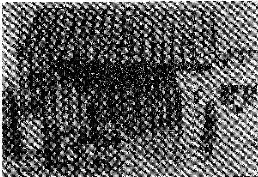
De waterput op de Huls rond de jaren dertig.

Midden in het dorp - het tegenwoordige Dr. Poelsplein - bevond zich een grote vijver (voor het hele dorp: "der Weijer") die gevoed werd door de Eyserbeek. Deze vijver deed dienst als regelaar voor de twee graanmolens: de "Oude Molen" en de "Bulkumsmolen". Door middel van sluisen, zogenaamde "erke", kon de waterstand die voor het in bedrijf stellen van de molens nodig was geregeld worden. De "Weijer" diende ook als waterreservoir voor de brandbestrijding. Hierover straks meer.