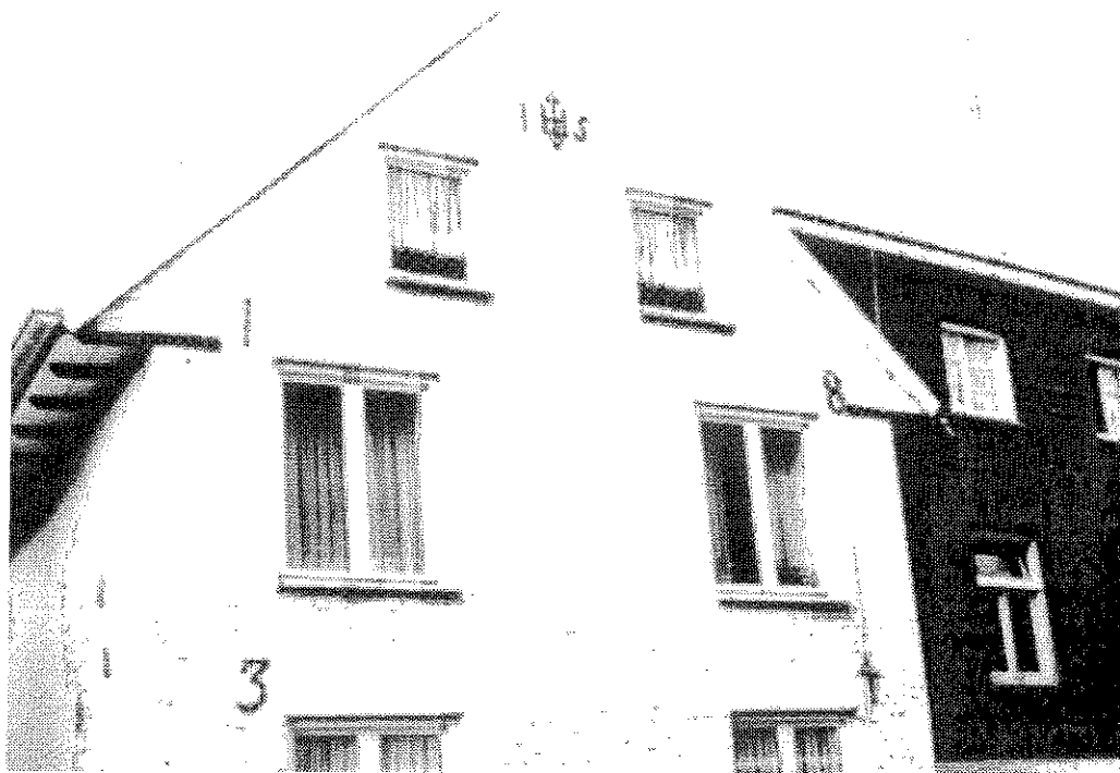
De muurankers geven het jaartal van de verbouwing aan.