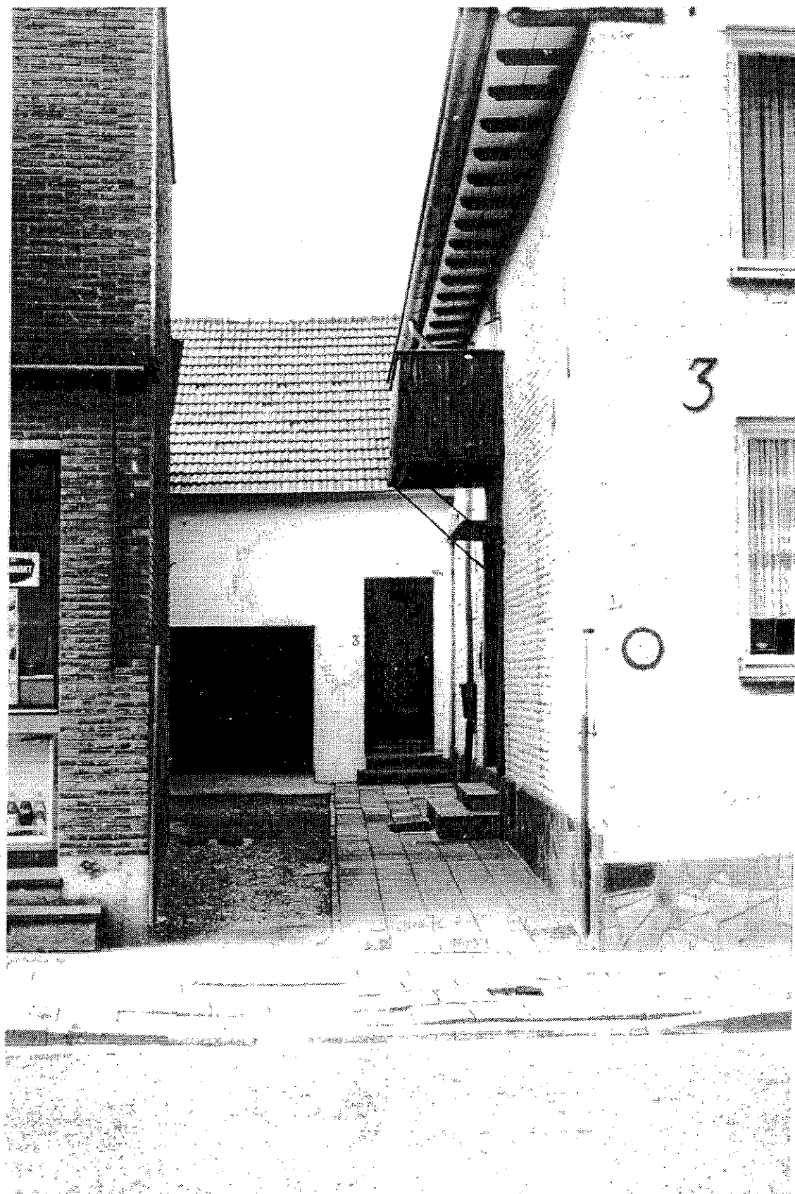
Pastoriestraat 3 - het "Oude Kosterhuis"